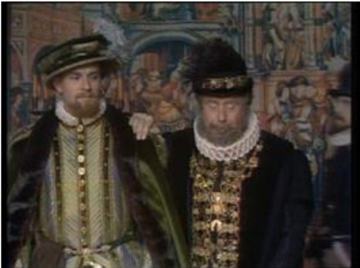
Foto toneelvoorstelling Willem van Oranje en zijn koning

Interessant is dat de Spaanse auteurs een onderscheid maken tussen de opstandelingen en de rest van de bevolking. De rebellen waren eigenlijk niet zomaar spontaan in opstand gekomen, zo stelt men zich voor. De schuld lag bij de ambitieuze en hebzuchtige Nederlandse adel. Het zijn de edelen geweest die het blinde en lichtgelovige volk van de Nederlanden hebben misleid en die de aanvallen op het katholieke geloof hebben toegestaan. Oranje in het bijzonder.