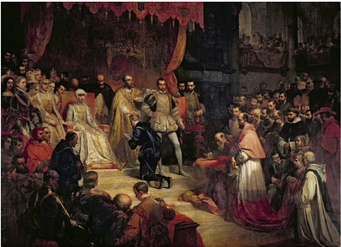
Aan het hof van Margaretha van Parma in Brussel

Alkmaar was dus niet bezet door de Spanjaarden, maar was een rechtmatig deel van dat grote rijk. In feite waren de Geuzen niet meer dan opstandelingen tegen het wettige gezag. De 'Spaanse' koning heerste over een machtige 'samengestelde monarchie', een rijk bestaande uit diverse koninkrijken en andere vorstendommen en heerlijkheden, zowel binnen het Iberisch schiereiland als daarbuiten. Filips II was dus de legitieme en natuurlijke vorst van de Lage Landen. In veel boeken, artikelen wordt dat volkomen onjuist weergegeven.